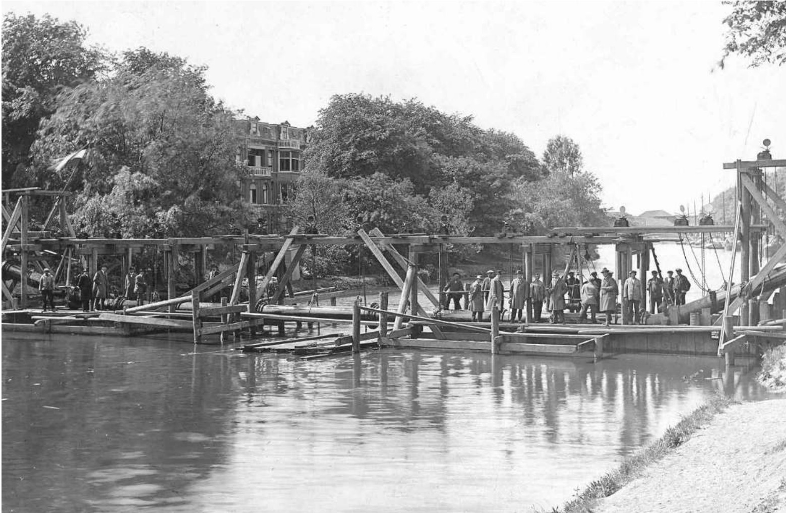
Zinkerlegging 600GGij (1926) Suezkade Den-Haag.