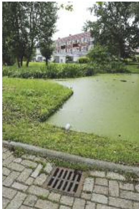
<< Door teveel voedingsstoffen verandert water in een groene soep